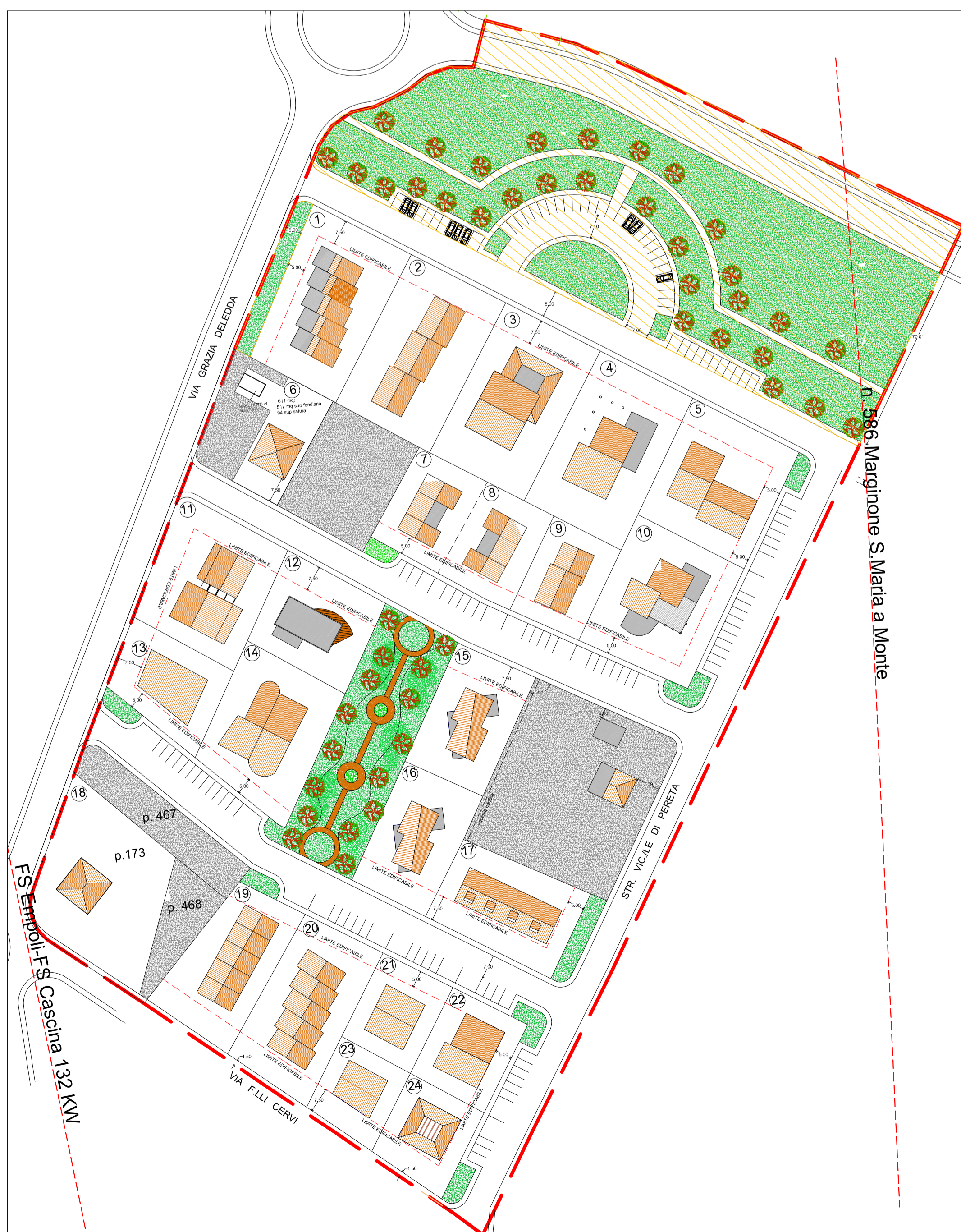
PLANIMETRIA SCALA 1/1000 STATO APPROVATO