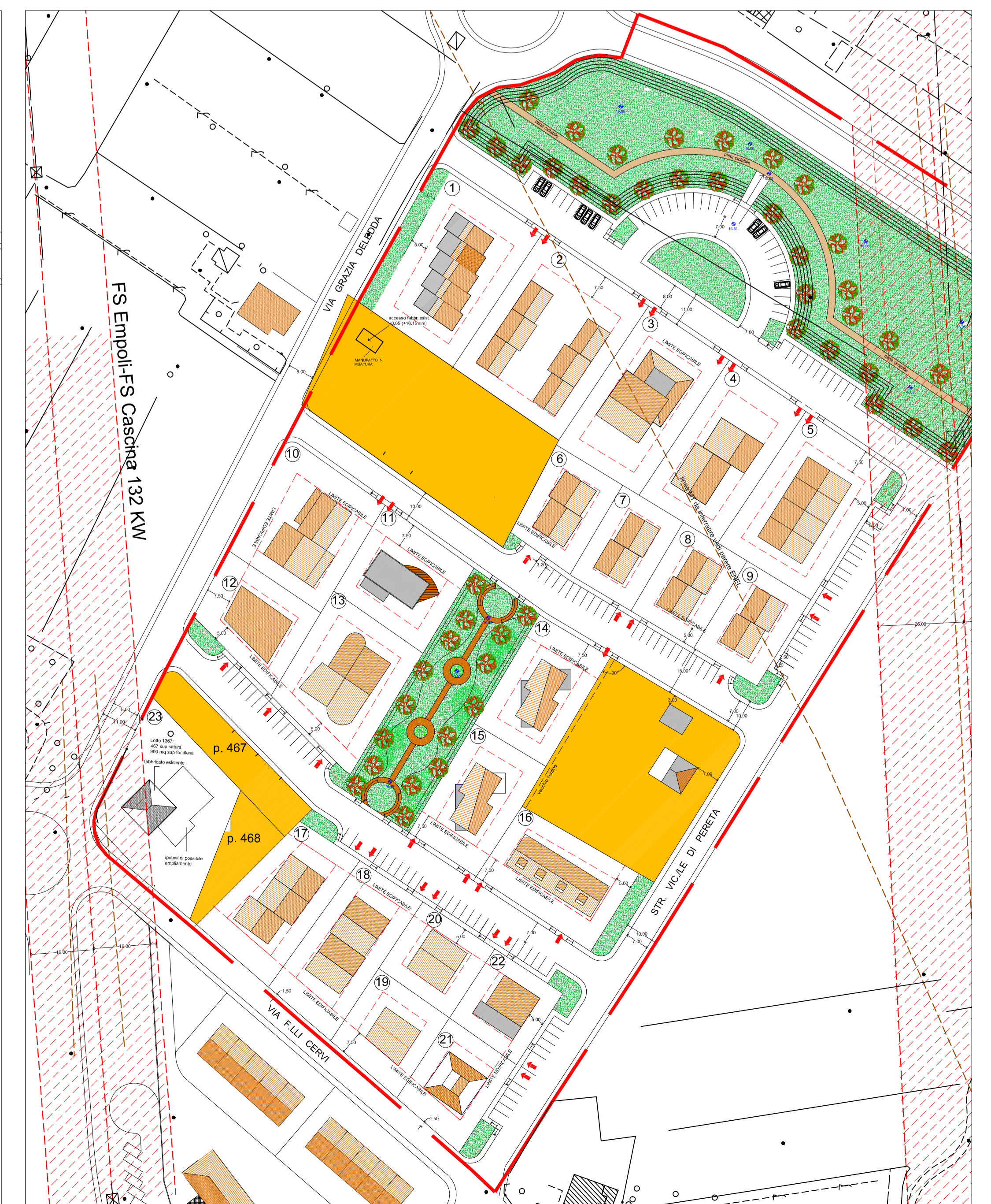
PLANIMETRIA SCALA 1/1000 STATO DI PROGETTO