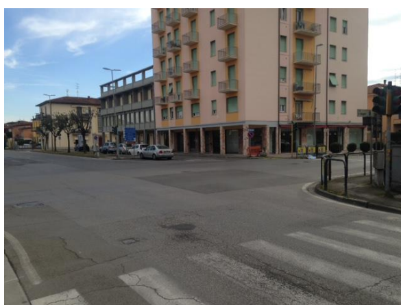
Area intervento 3 – Realizzazione rotatoria incrocio viale Europa-via Francesca Nord