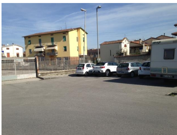
Area intervento 2 – Modifica accessibilità parcheggio via Solferino