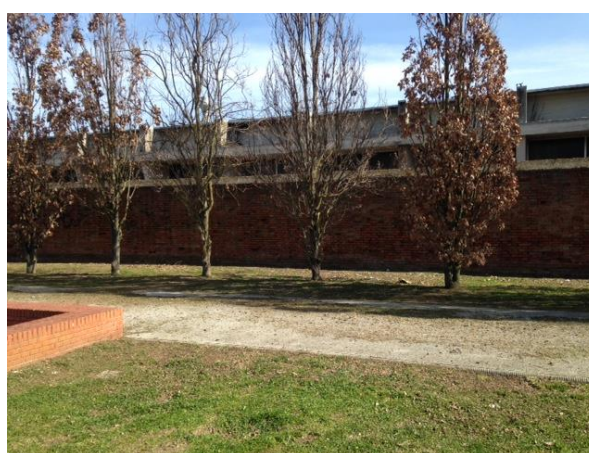
Area intervento 1 – Apertura varco su parco pubblico attrezzato