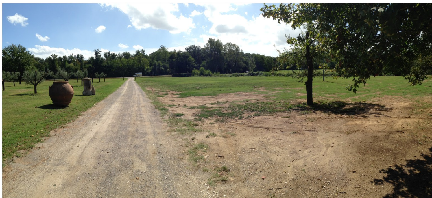
Foto n. 2 - Vista di insieme dal fabbricato, verso la via provinciale Valdinevole