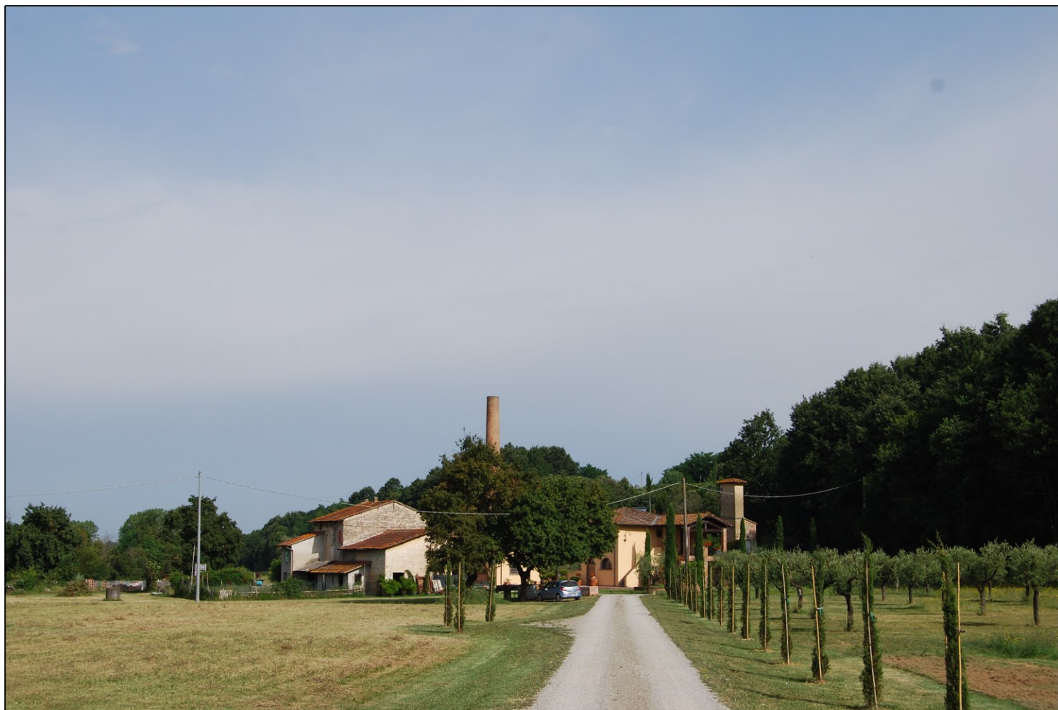
Foto n. 1 - Vista di insieme del complesso, dalla via provinciale Valdinevole