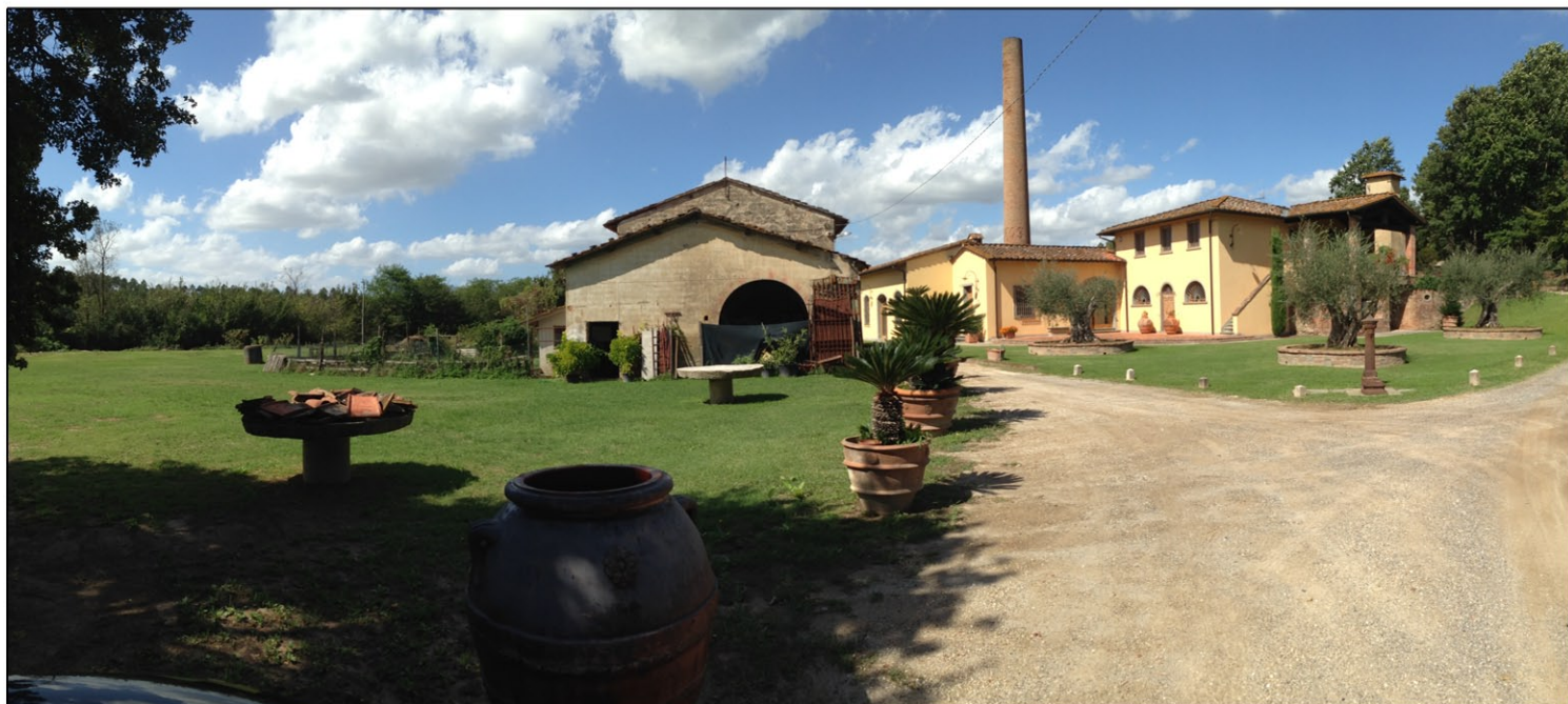
Foto n. 3 - Vista di insieme da sud, dal viale di accesso alla proprietà. Si vedono il fabbricato principale e quello secondario da recuperare