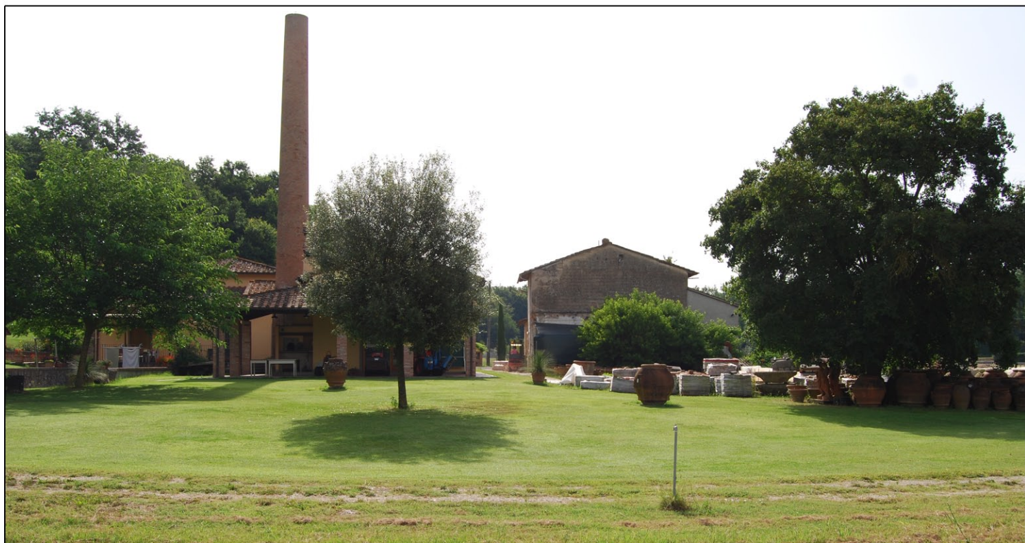
Foto n. 6 - Vista di insieme da nord, del prospetto laterale e del fabbricato principale