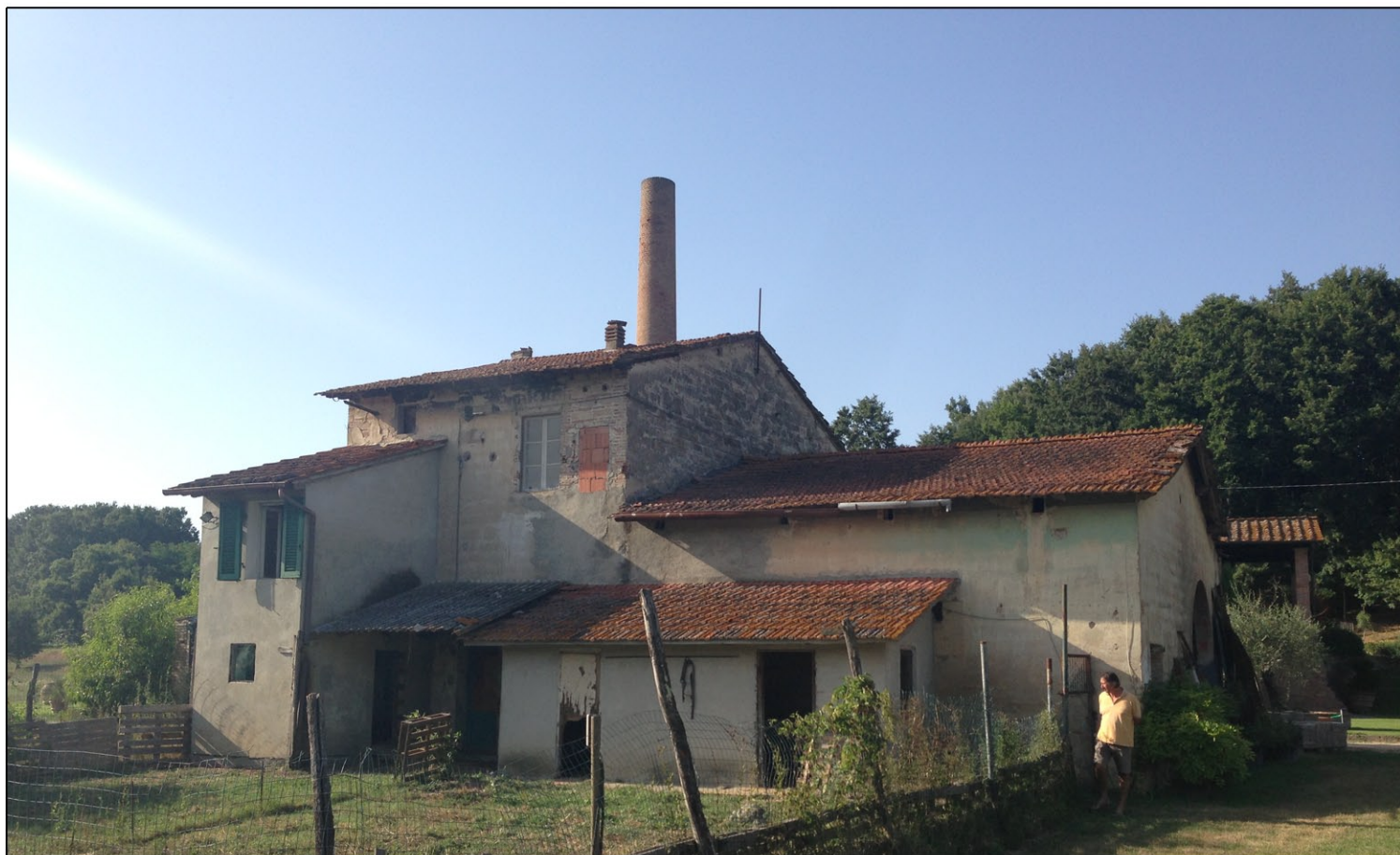
Foto n. 5 - Vista del retro del fabbricato