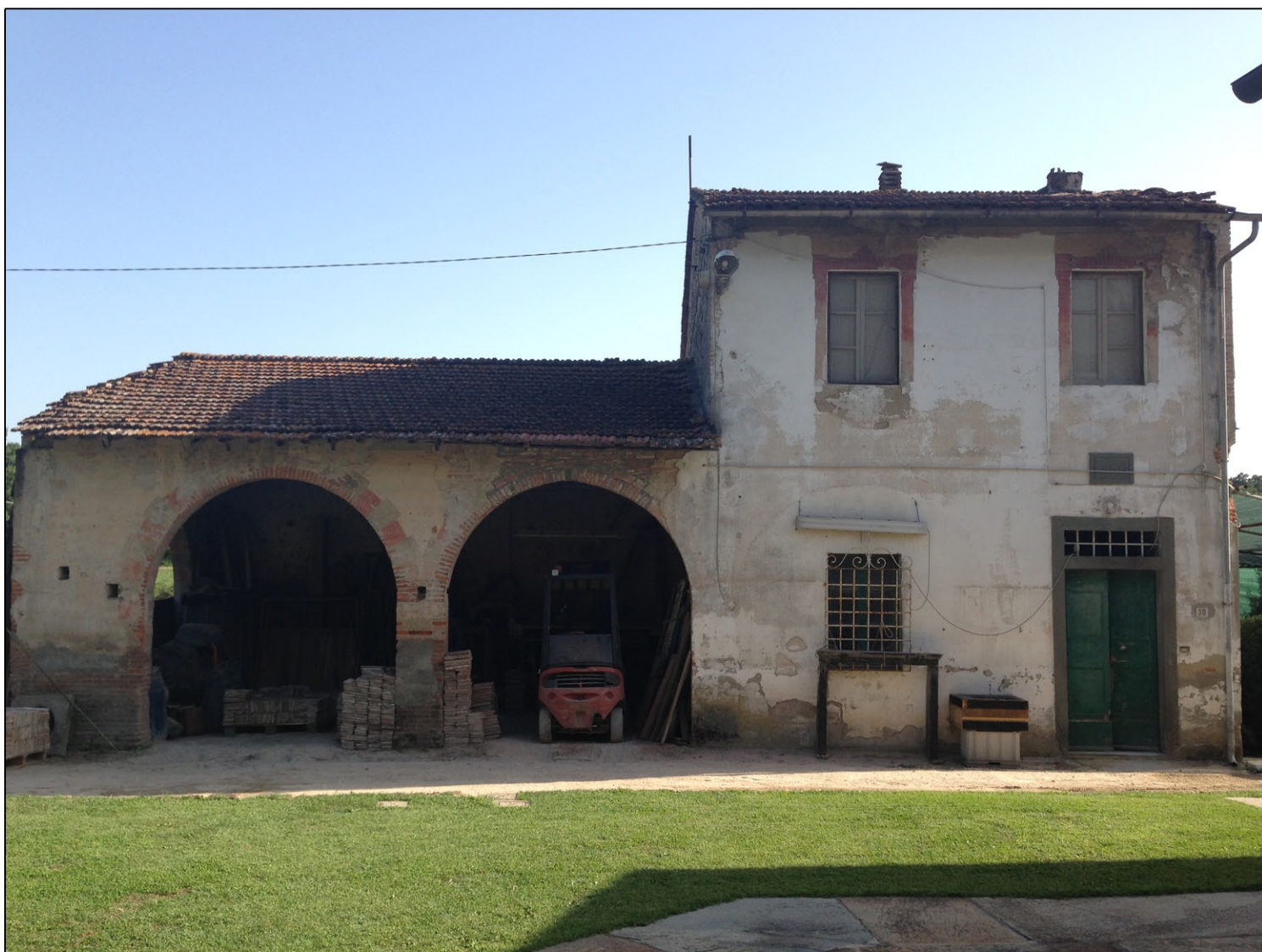
Foto n. 4 - Vista del prospetto principale del fabbricato da recuperare